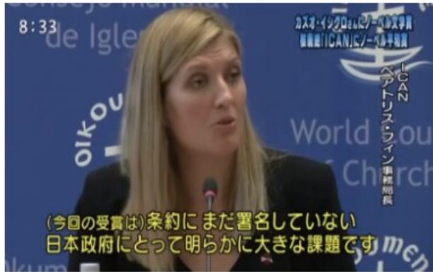
8:33 (今回の受賞は)条約にまだ署名していない日本政府にとって明らかに大きな課題です