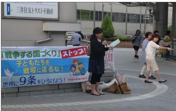
6月9日の豊中駅での市民宣伝