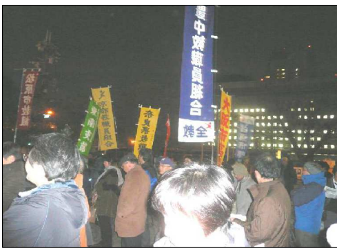
他県教組の応援もあった1月19日の決起集会