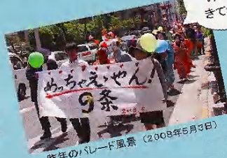
昨年のパレード風景 (2008年5月3日)

今年も同じ時間に、同じ ルートで歩きます。 パレード初体験の人も 大歓迎。風船を手に、 シャボン玉を飛ばしな がら、みんなで楽しく歩 きましょう!