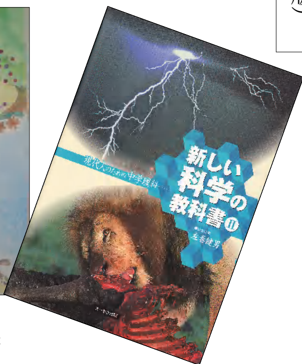
(右) 旧版となる中学校用本