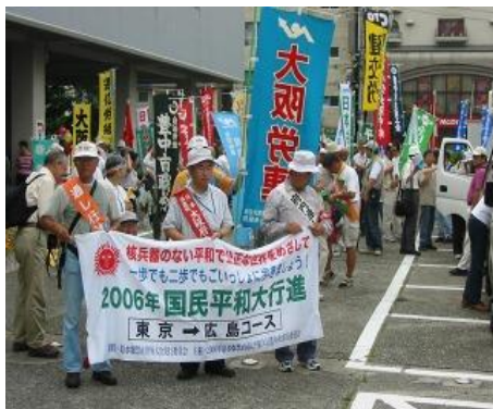
2006年平和大行進の市役所前