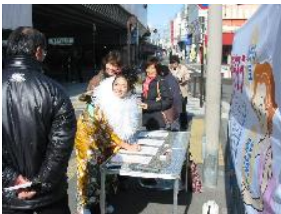
成人式での宣伝の様子 (06.01月)

労働条件改善等など、課題もいっぱいあります。全教豊中は今年も、全力でがんばります。