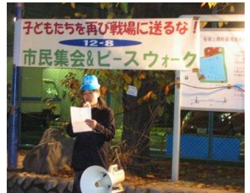
12月8日集会でアピール