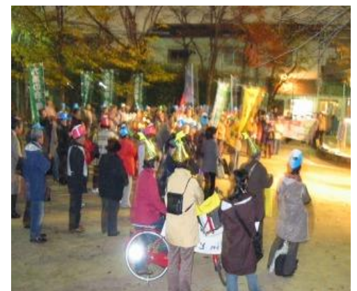
12月8日の9条の会・豊中主催の市民集会の様子